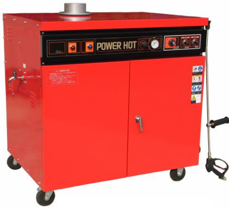
STR-50HA. 70R. 70HR