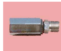
スピンジョイント