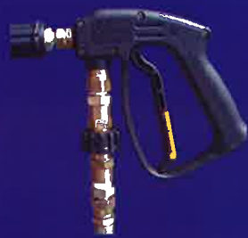
クイックカップリング