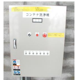
簡単ワンタッチ操作盤!!